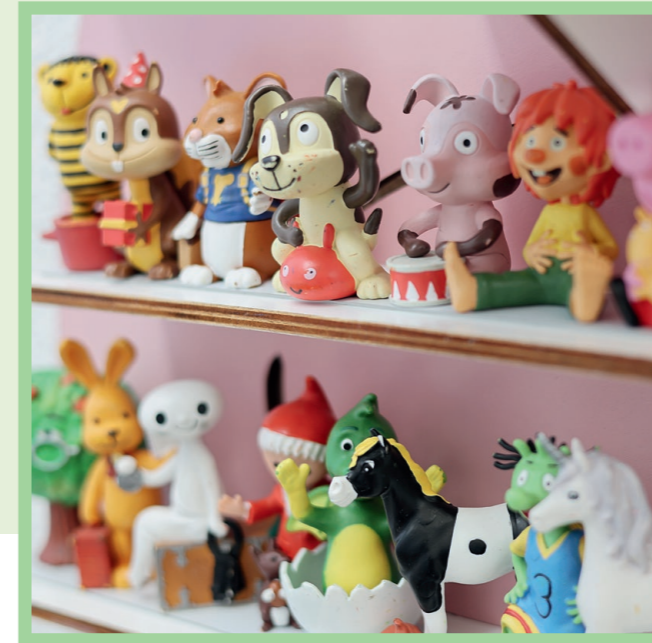
Unbeschwert spielen und Neues entdecken: Die Bereitschaftspflegekinder werden bei Cindy kreativ und vielfältig gefördert.