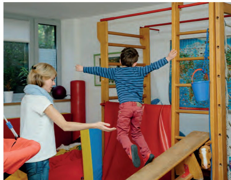
Physiotherapeutinnen begutachten das Kind und fördern dessen Bewegungsmöglichkeiten.

Gerade motorische Schwierigkeiten fallen schnell auf: Babys, die sich noch nicht drehen oder Kleinkinder, die sehr unsicher laufen. Schon sehr früh können die Physiotherapeutinnen vor Ort das Kind begutachten und durch intensive Förderung die Bewegungsmöglichkeiten des Kindes unterstützen und gezielt erweitern. Neben ihrer