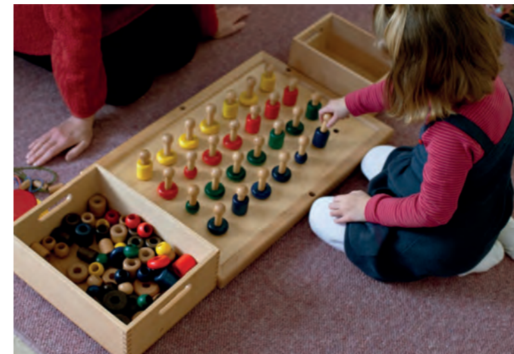
In der heilpädagogischen Förderstunde machen die Kinder spielerisch Fortschritte.

direkten Arbeit mit den Kindern beraten sie auch die Kolleg:innen in der Gruppe, wie das Kind auch im Alltag möglichst gut angeregt werden kann.