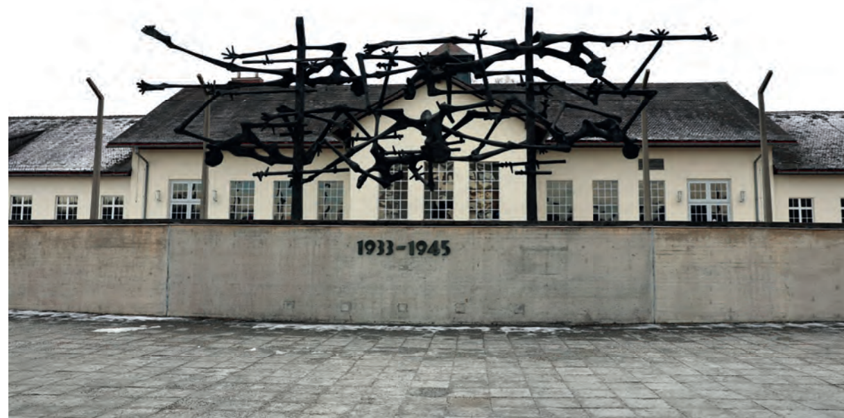
Nie wieder: Das Internationale Mahnmal auf dem ehemaligen Appellplatz ist der zentrale Gedenkort zur Erinnerung an die Opfer des Konzentrationslagers Dachau.

45 Minuten dauert eine Unterrichtsstunde – oft zu wenig Zeit, um wichtige Inhalte wie den Holocaust zu behandeln. Das Projekt „Tanzen und Geschichte“ eröffnet einen kreativen Raum, um sich eine Woche lang intensiv mit dem Thema zu beschäftigen. Drei Schülerinnen und eine Lehrerin der Franz von Sales Schule Niedernfels haben sich darauf eingelassen.