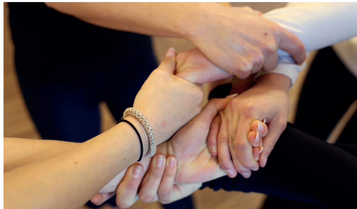
Ob im Tanzprojekt oder im Alltag: Die Gemeinschaft zählt.