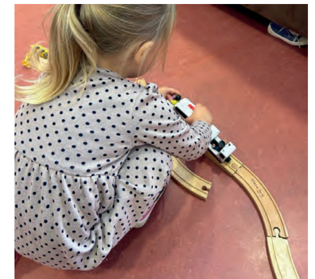
Sie fördert Konzentration und Feinmotorik.

mit den Wohngruppen. Sie haben keine Angst, alleine zu den Therapeutinnen zu gehen, wenn diese sie aus der Gruppe abholen. Damit kommt auch automatisch der wertvolle Austausch zwischen Gruppe und Fachdienst zustande – wie geht es dem Kind heute, wie lief die Förderstunde, was sind die Sachen, die geübt werden können? All das braucht aber Zeit – der Austausch, und natürlich, bis das Kind fertig gespielt hat und beim Therapieraum angekommen ist. Auch der Weg dorthin ist Förderung, und gerade für beziehungs-traumatisierte Kinder ist der Übergang von der Situation in der Gruppe zum Einzelkontakt mit der Therapeutin ein großer Schritt.