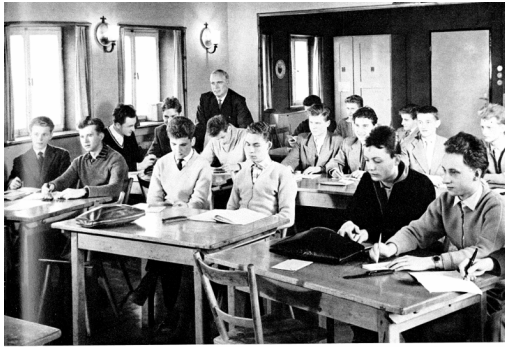
▲ Abituristenlehrgang zur Vorbereitung auf die Sonderprüfung