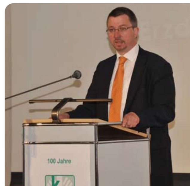
„Ein starkes Stück Kirche in dieser Gesellschaft.“

Müller forderte die KJF auf, sich weiter als „ein starkes Stück Kirche in dieser Gesellschaft zu platzieren“. In Gestalt der KJF sei die Kirche ein wesentlicher Partner der Landeshauptstadt, der zeige, dass das Engagement von Menschen ganz zentral in der Gesellschaft