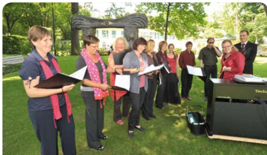
Die musikalischen Mitarbeiter von Steinhöring.