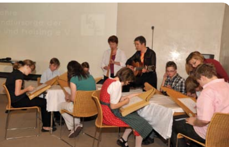
Die Saitenreißer mit ihren Veeh-Harfen in Aktion.

der Herr, der mein Haupt erhebt“ und „We shall overcome“. Die Saitenreißer sind acht Jugendlichen im Alter von 14 bis 16 Jahren, die auf so genannten „Veeh-Harfen“ gemeinsam musizieren.