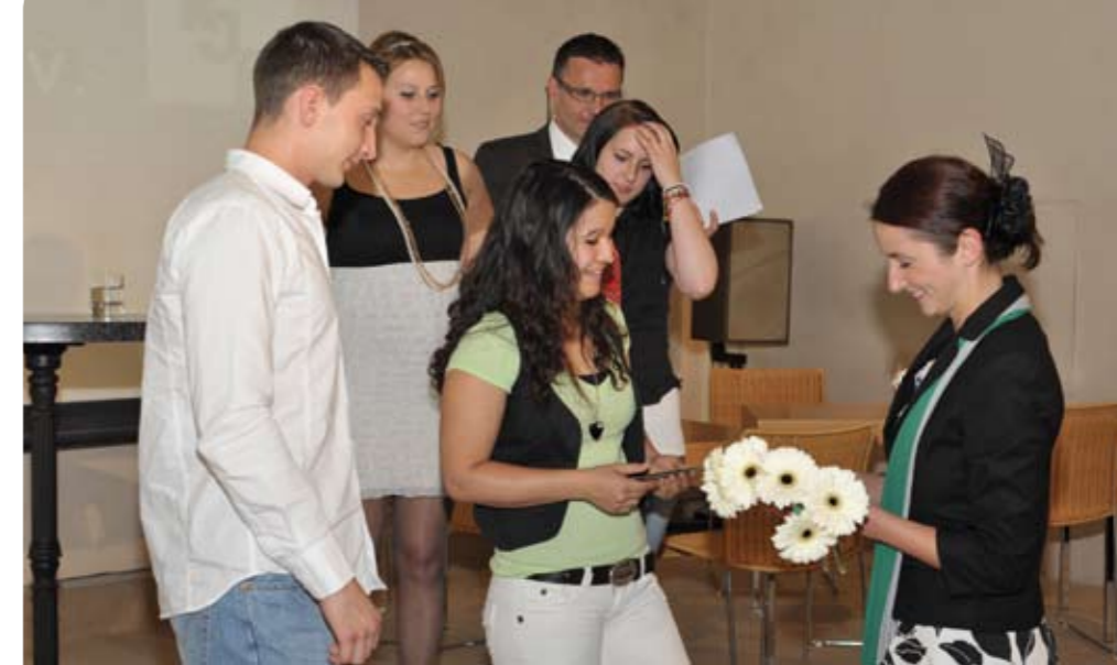
Bei der Übergabe der Präsente mit Blumen.

Und seine Pläne für die Zukunft? Er möchte die Lehre gut abschließen und danach ein Jahr im Ausland arbeiten (work & travel). Längerfristiges Ziel ist die Meisterprüfung