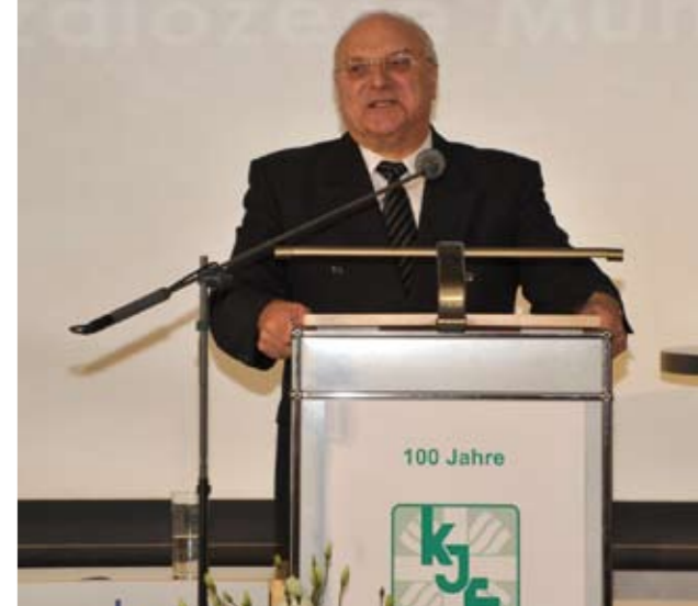
„Damit Menschen eine Zukunft haben.“

Heute seien die Katholischen Jugendfürsorgen Mitglieder in der Landescaritaskonferenz und in den Arbeitsgemeinschaften der Caritas (Arbeitsgemeinschaft Förder-schule, Arbeitsgemeinschaft Kinder- und Jugendhilfe, Arbeitsgemeinschaft Behindertenhilfe und Landesverband Katho-